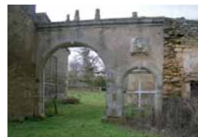
L'ancien portail - Domaine de Malaguet

Des résidences aisées associées à des exploitations agricoles