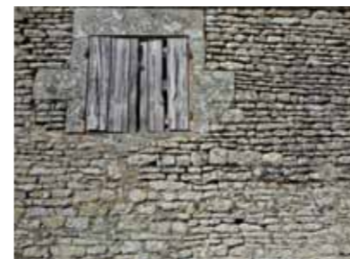
Mur d'habitation en moellon