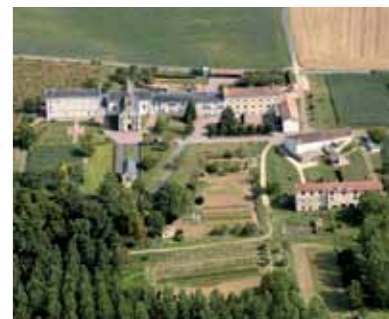
Le couvent de Salvert - Vue aérienne