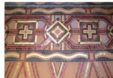
Détail de la mosaïque de la nef de l'église

Une mosaïque murale anime la base des murs et souligne les lignes architecturales. Jeu coloré de drapés et de formes géométriques, elle sert de piédestal aux peintures murales et entoure le chemin de croix. Ces décors font la part belle à la Croix, véritable leitmotiv ornemental de l'église. Les quatorze stations du chemin de croix de la nef, la mosaïque et les verrières du transept émanent de l'atelier de Jean Gaudin (1879-1954), Maître verrier mosaïste de renom. Les épisodes narrés par les vitraux se font écho : d'un côté sainte Radegonde reçoit les reliques de la Vraie Croix, de l'autre la Croix apparaît à la foule de Migné.