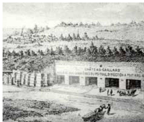
Les carrières de Château-Gaillard, vers 1895 Estampe ancienne

Durant la Première Guerre mondiale, une partie du site sert de dépôt de munitions et d'atelier de fabrication de cartouches. Le 8 décembre 1917, vingt deux femmes périssent dans l'incendie de la manufacture. Après la Première Guerre mondiale, le béton se substitue à la pierre de taille : l'exploitation des carrières périclité. Des galeries sont reconverties en champignonnières mais la culture est décimée par une maladie. Pendant la Seconde Guerre mondiale, les Allemands entreposent armes et butin de guerre dans les carrières. Si des salles souterraines ont continué à être utilisées en lieu de stockage de matériel militaire jusqu'en 1989, l'extraction de la pierre se perpétue à la carrière de Belle-Roche.