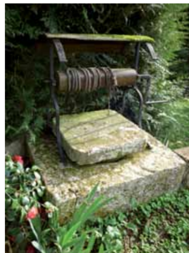
Puits - Rue de la Creuzette

Creusets de mémoire, puits, glacières* et souterrains racontent l'effort fourni par les hommes pour pallier leurs besoins. Nombre de puits subsistent sur les coteaux et le plateau. D'usage particulier ou collectif, la profondeur de leur forage atteint 48 mètres à Chardonchamps. La section circulaire du puits a souvent une margelle en pierre monolithe. A Malaguet, deux ouvrages maçonnés en sous-sol seraient des glacières. Plusieurs souterrains semblent avoir servi de refuge au Moyen Âge, comme le passage voûté, rue du Temps-Perdu, qui serpente sur 32 mètres de long. A l'intérieur se trouve un espace aménagé de banquettes et de niches.