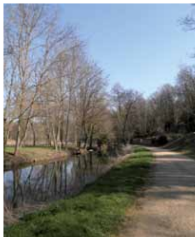
Les bords de l'Auxance

Limitrophe de Poitiers, la commune de Migné-Auxances couvre une superficie de près de 2 900 hectares. Son territoire est traversé d'est en ouest par une rivière sinueuse, l'Auxance, qui entaille le relief. Des coteaux calcaires dominent les méandres du cours d'eau qui conflue avec le Clain à Chasseneuil-du-Poitou. Vallée alluviale inondable, coulée verte, elle présente des espaces naturels variés : boisements et prairies humides, pelouses calcicoles*. Des terres agricoles et des voies de communication (route nationale, autoroute, voie ferrée) sillonnent la commune. Elle est un point de convergence et une zone de liaison.