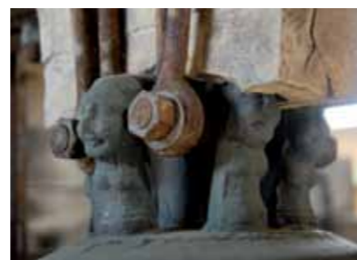
Les anses de la cloche Catherine - Eglise Sainte-Croix

Familères par leur présence sonore, suspendues entre ciel et terre, les trois cloches de l'église Sainte-Croix sont soustraites aux regards. En bronze, elles sonnent les heures et rythment la vie religieuse en signalant les célébrations. Parmi elles, Catherine, cloche fondue en 1653, possède un rare décor : ses anses sont formées de bustes de femmes souriantes. Le monogramme du Christ s'inscrit dans un médaillon qui surmonte un cœur percé de trois clous. Haute de 60 cm, elle possède une inscription et arbore les armoiries de l'abbaye de Montierneuf. Au n°1, rue du Centre, la cloche désormais muette de l'ancienne école de filles peut aussi se remarquer.