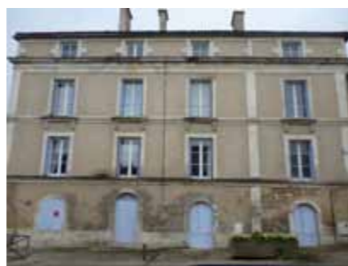
L'ancien relais de Poste - Rue de Saumur

Outre les axes de circulation automobile et ferroviaire, les communications sont présentes à Migné-Auxances via le service des postes. A commencer par l'ancien relais rue de Saumur, où au milieu du XIX e siècle, messagers et voyageurs font halte pour changer de monture, se restaurer ou se reposer. L'actuel bureau de poste s'est installé dans l'ancienne mairie en 1978. Depuis 2009, la plateforme industrielle de courrier (PIC) traite sur 16 800 m 2 tout le courrier du Poitou-Charentes grâce à 280 salariés et 9 machines ultramodernes.