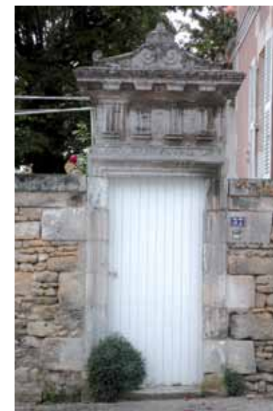
Porte piétonne couverte d'un fronton orné de volutes et d'éléments de sculpture - Rue de Saumur