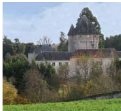
Le château de l'Auxances - Vue depuis Sigon

Élément emblématique du château fort, le donjon matérialise le pouvoir féodal. Poste de guet et de tir, refuge en cas de siège, son rôle militaire se double d'une fonction résidentielle. Construit à la charnière des XI e et XII e siècles, le donjon d'Auxances aux murs épais a été remanié. De plan carré, il s'élève sur plus de dix mètres compartimentés en six niveaux. Une tour d'escalier et une poivrière* à toits coniques sont accolées à la structure coiffée d'un toit à quatre pans. Au sommet, le chemin de ronde sur mâchicoulis présente une alternance de meurtrières et de petites baies avec un décor de moulures.