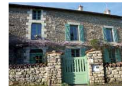
Le moulin du Cimetière - Rue du Centre

Vers 1860 une cartonnerie s'installe au moulin du Pré. L'usine donne une seconde vie à du papier écrasé. Si sa cheminée de briques a été détruite, une roue et des engrenages subsistent. Quant au moulin du cimetière devenu minoterie, il est converti un temps en brasserie.