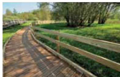
Circuit aménagé - Zone humide du Pré Armé

Au cœur du bourg de Migné, les circuits du Pré Armé et de la Garenne, près de la mairie, réservent de belles balades. Une partie de ces zones humides, ceinturée par les sinuosités de la rivière, forme une île. Refuge préservé d'une faune et d'une flore luxuriantes, c'est une zone d'expansion des crues. L'aménagement d'un sentier de découverte sur pilotis permet de percevoir les secrets de cet écrin végétal grâce à des panneaux pédagogiques.