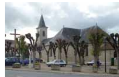
La place de l'église

Migné et Auxances : deux vocables et deux villages accolés forment aujourd'hui un nom, une commune. L'un dérive du latin magnacum qui peut se traduire par « avec grandeur », l'autre a trait à la forme de la rivière, c'est-à-dire la rivière « aux anses ». Depuis des millénaires, l'homme arpente la vallée et ses coteaux : le menhir de la Pierre Levée des Lourdines et l'archéologie attestent de sa présence dès le Néolithique. Dans l'Antiquité, la voie romaine reliant Poitiers à Nantes franchit l'Auxance à gué.