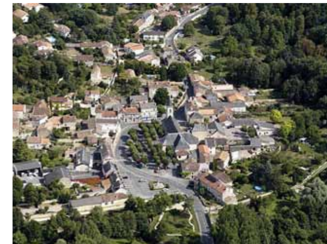
Le bourg de Migné-Auxances - Vue aérienne

Un développement intimement lié à la proximité de Poitiers