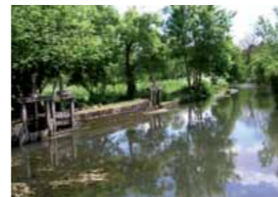
Vue du canal - Moulin Bertault

Une force motrice ponctuée de moulins et d'usines