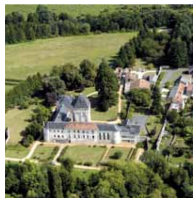
Le château de l'Auxances - Vue aérienne

Vers la fin du XI e siècle, Foucault, sire de la Roche, édifie un château. Au creux d'un méandre de l'Auxance, à l'orée du village, le donjon contrôle le passage à gué de la rivière. Le fief relève de la Tour Maubergeon. Le seigneur exerce un droit de justice auquel s'ajoutent des droits de moulin banal, de pêche, de garenne, de fuye et de mesure*. Transmis par legs au sein de la famille de La Roche-Foucault, le domaine connaît à partir de 1434 maints propriétaires, différents statuts et plusieurs phases de construction. Au XV e siècle, le donjon et la basse-cour sont ceinturés de fausses-braies* et de fossés. Lors des guerres de Religion, le château est le théâtre de violents affrontements aux cours desquels périssent près de 200 hommes. Du XVI e au XVIII e siècle, des bâtiments cantonnés de quatre tours viennent avoisiner le donjon, ce qui confère à l'ensemble l'actuelle forme d'équerre. Le plan cadastral de 1839 indique la présence du pigeonnier, de douves et d'un pont-levis.