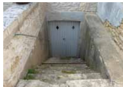
Escalier d'une maison de vigneron - Rue des Cosses

L'agriculture Les larges escaliers droits permettant le passage des barriques dans les maisons de vignerons, les vastes chais, pressoirs et caves demeurent les seuls témoins d'une activité passée. La culture du chanvre, du lin et du tabac est indiquée par la présence de séchoirs dont les claires-voies visent à laisser l'air circuler.