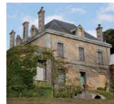
Le manoir - Domaine de Malaguet

Sous l'Ancien Régime (XVI e -XVIII e siècles), les manoirs de Salvert, de Sigon et de Verneuil, à l'écart du village, sont reconstruits pour des notables de Poitiers. Clos de murs, ces logis de plan rectangulaire entre cour et jardin sont joutés d'une chapelle et de communs (pigeonnier, écuries, chais avec pressoir). Leurs façades en gouttereau présentent des moulures. Les lucarnes, ouvertes dans le toit en croupe, s'ornent de volutes. Le seuil donnant sur l'escalier central se distingue par un traitement raffiné. A Sigon, la travée d'entrée comporte un balcon dont le garde-corps aérien en fer forgé prélude la rampe d'escalier où se déploient d'amples arabesques.