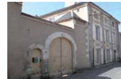
Logis d'habitation et passage couvert - Rue du Centre

A proportion équivalente, fermes et maisons révèlent le double visage de Migné-Auxances : une commune à vocation agricole et à caractère résidentiel, entre ville et campagne. Les habitations remontant à l'Ancien Régime sont souvent resserrées autour de « querreux », cours communes à plusieurs maisons. Au XIX e siècle, le peu de contraintes spatiales et l'essor de l'agriculture favorisent la construction d'amples habitations, souvent pourvues d'une cave et d'un grenier. D'imposantes granges-étables attestent de l'importance des récoltes sur quelques exploitations. La prospérité se lit sur les façades : des décors de moulures, de volutes, d'accolades peuvent venir agrémenter portes et fenêtres. Aux XX e et XXI e siècles, les lotissements concertés et les pavillons se multiplient. Ils densifient le maillage urbain et réduisent l'écart entre bourgs et hameaux.