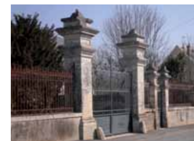
Portail - Rue de Limbre

Au XIX e siècle, des remaniements visent à améliorer le confort des « demeures des champs ». A Malaguet, la famille Demarçay édifie un manoir flanqué de deux pavillons octogonaux sur un soubassement à usage de chai. Les façades sont animées de bandeaux saillants, de corniches moulurées et de larmiers en anses de panier. Une terrasse avec balustrade en pierre et voile d'ombrage domine la vallée : elle prolonge au grand air le salon de réception et mène au parc par un escalier à double volée.