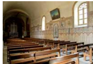
L'église Sainte-Croix - Vue intérieure

Lors de la reconstruction de l'église, après 1826, l'église est réorientée dans le sens de l'apparition de la Croix : le portail d'entrée donne ainsi à l'est. La façade, percée d'une porte en arc plein-cintre surmonté d'un fronton, est dominée par le clocher. A l'intérieur, le voûtement de la nef unique est en berceau, celui du chœur est en cul-de-four*. Les bras du transept accueillent chacun une chapelle. Une plaque en façade et une croix suspendue à la croisée du transept rappellent l'apparition de la Croix dans le ciel mignannois. La sobriété architecturale de l'église contraste avec la profusion de son décor des années 1930.