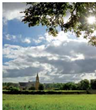
Le couvent de Salvert

Lieu de vie communautaire des Filles de la Sainte-Vierge