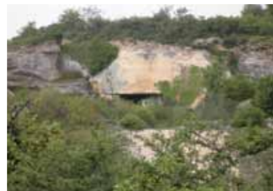
Les carrières des Lourdines

L'étonnante découverte de plusieurs crocodiles marins fossilisés longs de 3 mètres rappelle le temps où le Poitou était une zone de hauts fonds parsemée d'îles. Les carrières d'extraction fournissent un matériau de construction réputé pour sa résistance, sa densité et la beauté de son grain. Lieu d'extraction à ciel ouvert dès l'Antiquité, les carrières des Lourdines approvisionnent les prestigieux chantiers de Poitiers : une partie de la façade romane de Notre-Dame-la-Grande, les cheminées flamboyantes du palais des comtes de Poitou-ducs d'Aquitaine, etc.