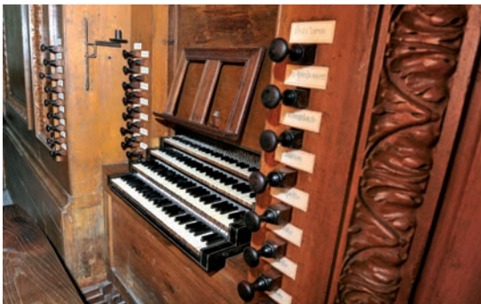
Console de l'orgue Clicquot

Son fils Claude-François Clicquot achève ce monument. En 1791, juste après les tourmentes de la Révolution, l'orgue Clicquot chante dans l'immense vaisseau de la cathédrale. Il repose sur une tribune édiflée en 1778 par l'architecte Vétault.