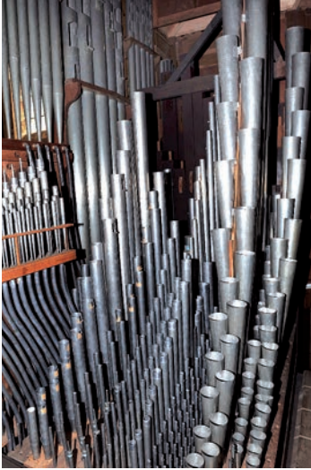
Vue générale de la tuyauterie de l'orgue - Église Saint-Hilaire-le-Grand