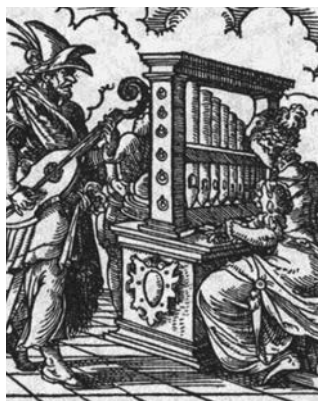
Gravure d'un organiste, 1568