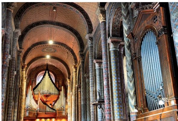
Au premier plan, l'orgue de chœur de Notre-Dame-la-Grande