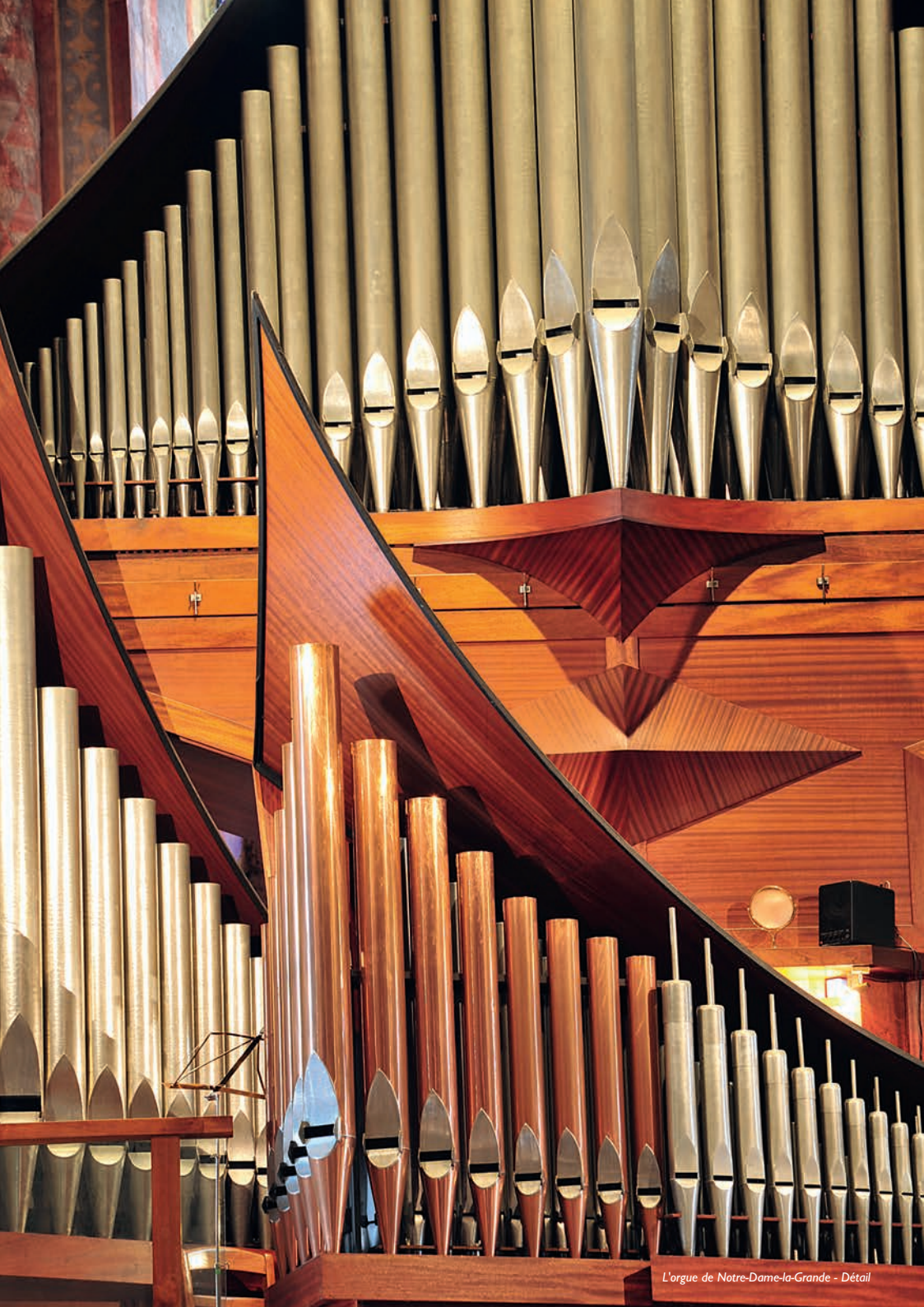
L'orgue de Notre-Dame-la-Grande - Détail