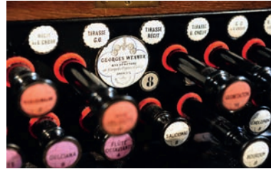
Marque du facteur d'orgue Wenner - Église Saint-Hilaire-le-Grand

Œuvres d'art de grande valeur, certains orgues sont de véritables chefs d'œuvres d'ébénisterie et de sculpture, parfois même de peinture et de dorure. Fabriqués sur mesure et selon des techniques traditionnelles, les buffets sont parfois somptueusement décorés. En dehors de leur rôle esthétique, leur fonction est d'abriter la quasi-totalité des parties techniques et mécaniques. Sous leurs façades sculptées, peintes et dorées, les orgues cachent bien leur jeu : leurs entrailles recèlent de très nombreux éléments invisibles du public mais indispensables à leur fonctionnement.