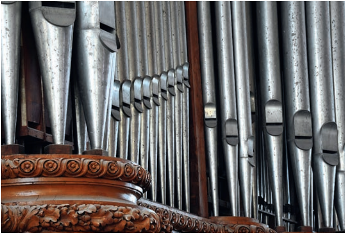
Les tuyaux d'orgue

Avec ses 44 jeux commandés par 4 claviers et un pédalier, l'instrument s'ajuste à l'acoustique de la cathédrale où la réverbération atteint 7 secondes. L'esprit classique, empreint de mesure, d'équilibre et de rigueur, a dicté la conception musicale de l'instrument, adapté au gigantisme de l'édifice. La beauté et la puissance de son grand chœur d'anches dont les sonorités s'apparentent à celles d'instruments à vent tels que les bombardes, trompettes ou clairons, participent à sa célébrité. La plupart de ses 3 023 tuyaux sont en alliage d'étain fin et de plomb martelé soudés à un pied de plomb de manière à assurer leur stabilité. La mécanique et le circuit du vent misent sur la simplicité et la robustesse.