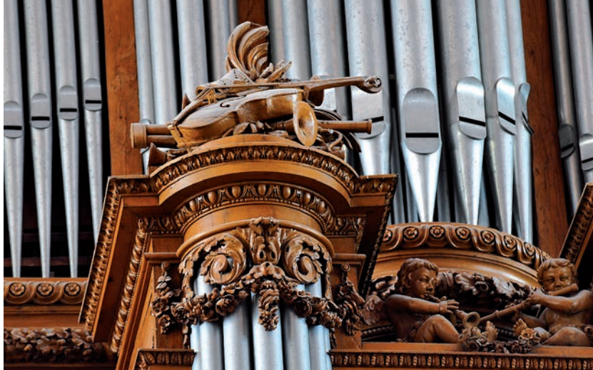
Décor sculpté de l'orgue Clicquot - Cathédrale Saint-Pierre