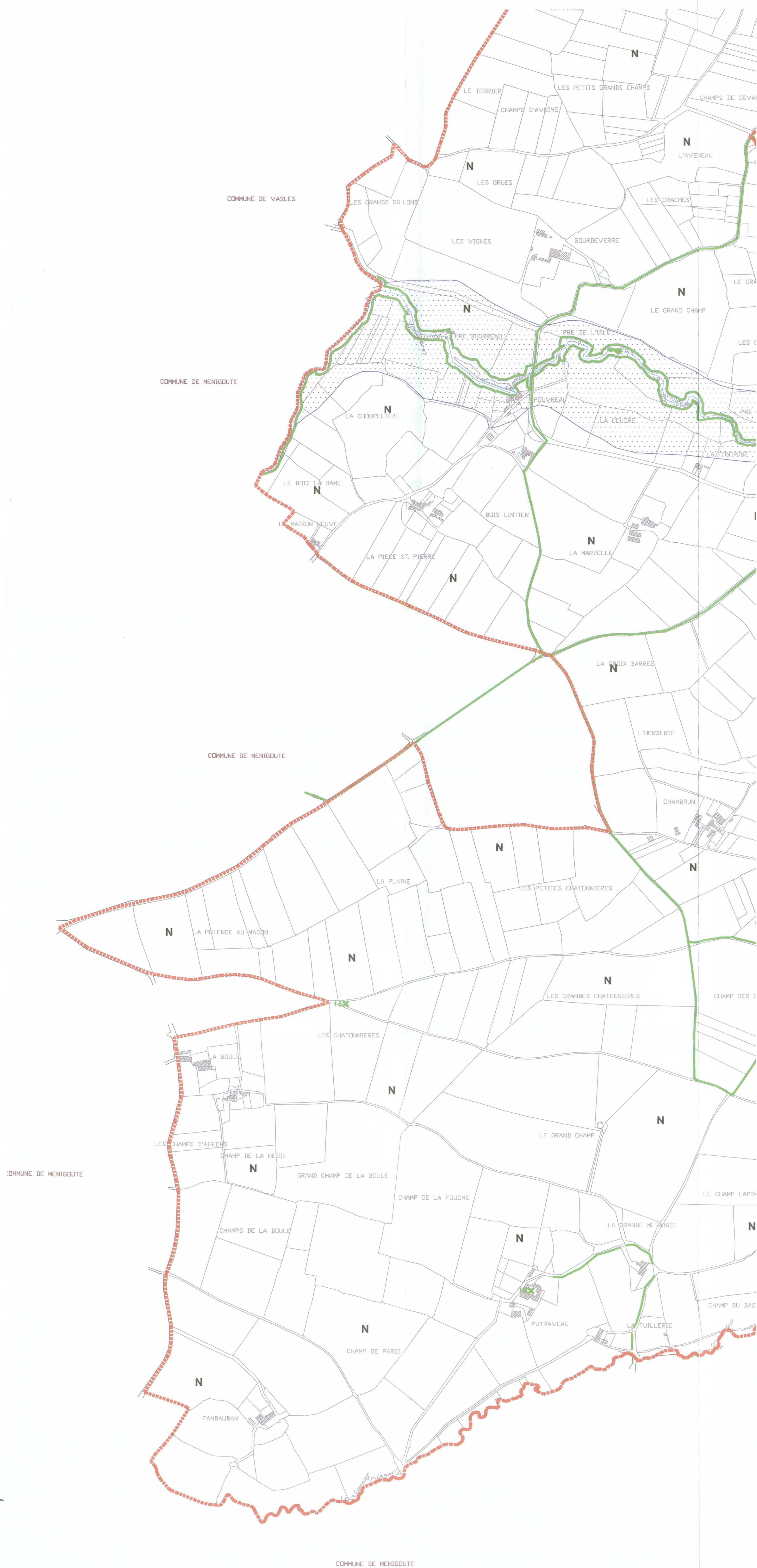
Planche 2 échelle 1/5000

ECP Urbanisme Christine Guérif - Urbaniste