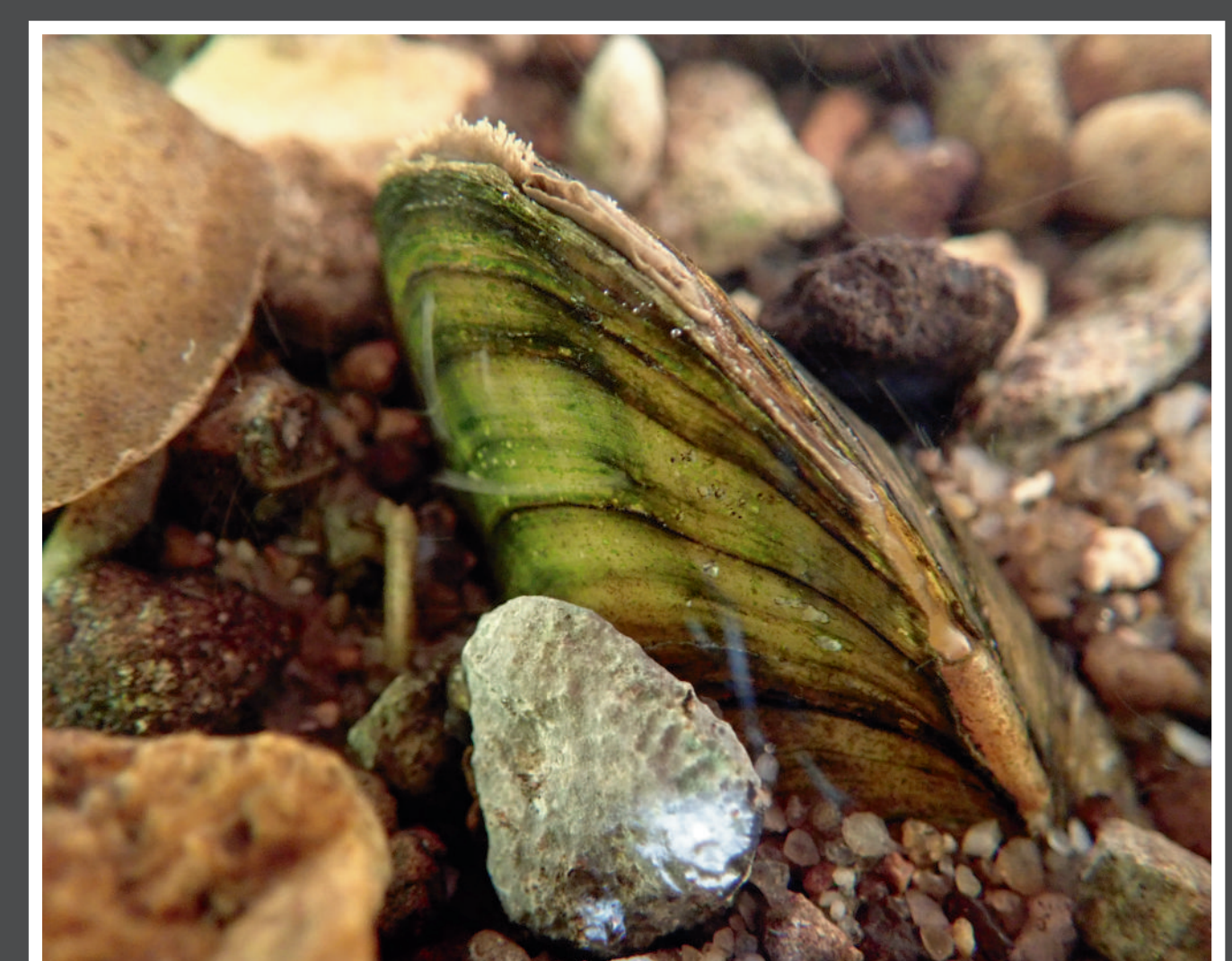
Seule espèce protégée sur Grand Poitiers, la Mulette épaisse Unio crassus a été vue dans sept cours d'eau du territoire.