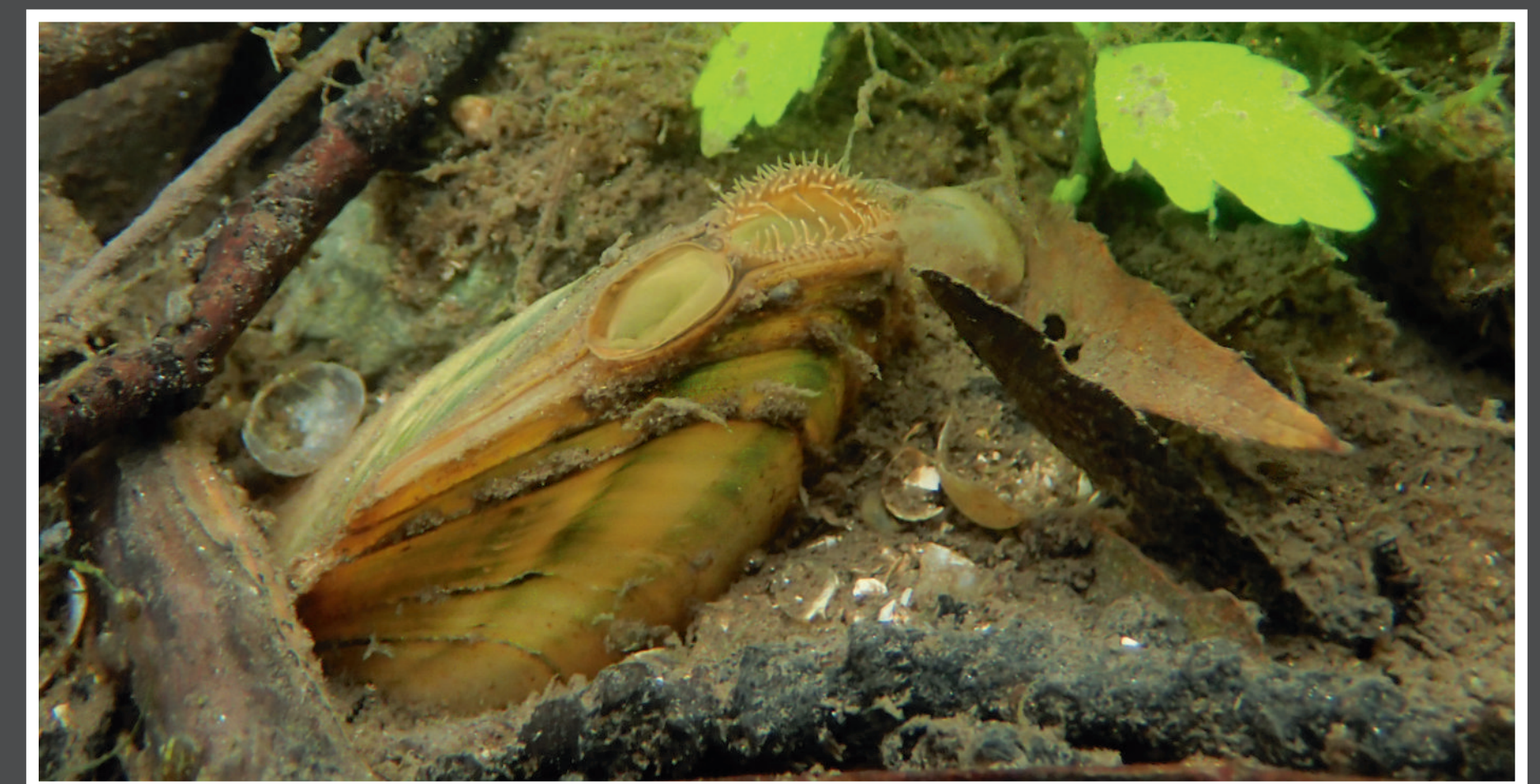
L'Anodonte des rivières Anodonta anatina , présente le plus souvent sur les zones lenticques des cours d'eau, a été identifiée vivante dans six cours d'eau du territoire de Grand Poitiers.

Cette action avait pour objectif d'améliorer les connaissances sur la répartition de ces espèces sur le territoire de Grand Poitiers et de les prendre en compte dans le cadre des travaux de restauration de cours d'eau réalisés par les syndicats de rivière et la Fédération départementale de la Vienne pour la pêche et la protection du milieu aquatique.