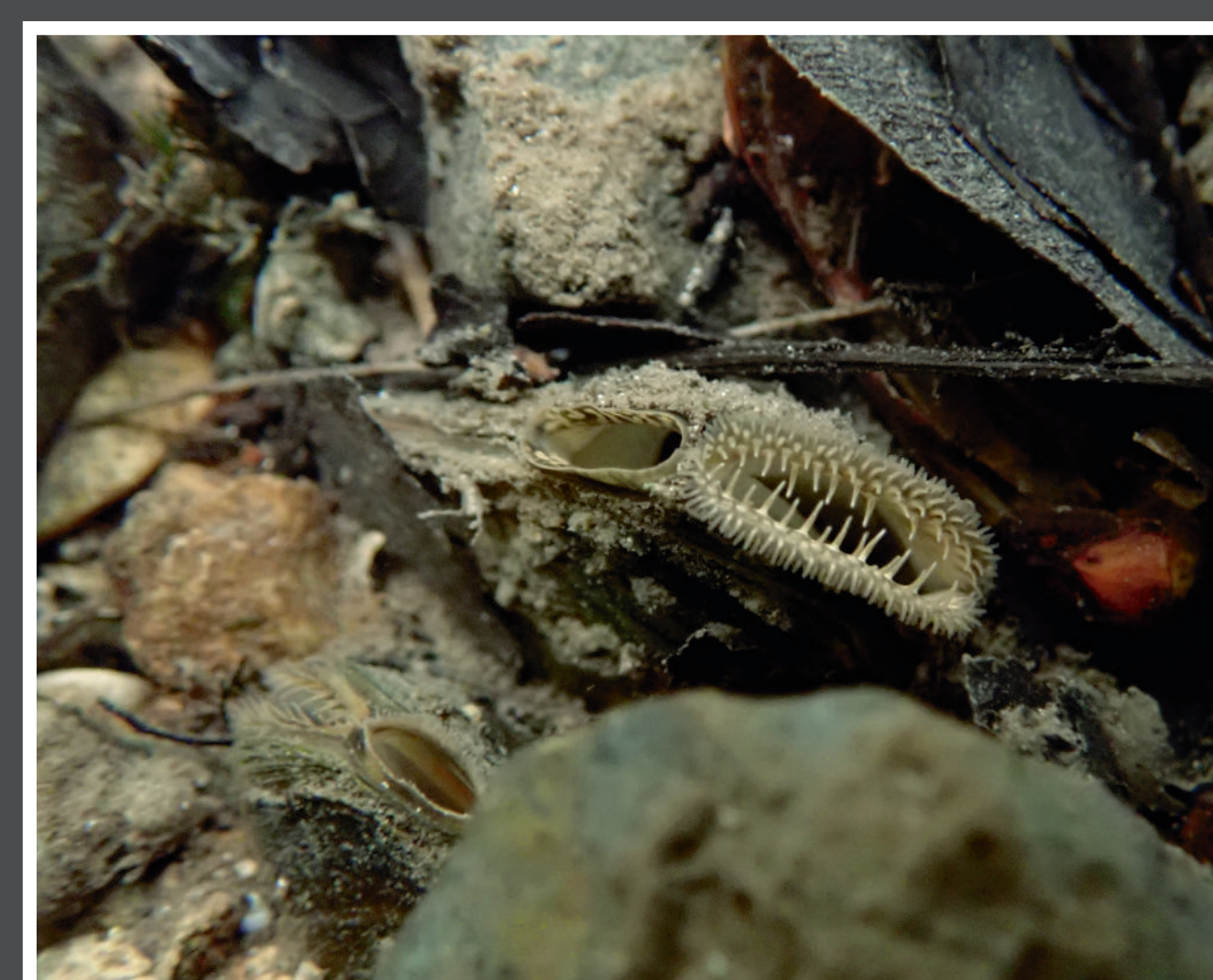
La Mulette des rivières Potomida littoralis affectionne les zones de courant des cours d'eau et a été observée dans quatre cours d'eau.

En 2021 et 2022, des recensements et suivis des populations de Mulettes ont été menés dans 10 cours d'eau de Grand Poitiers au sein de 20 secteurs de travaux de restauration portés par les syndicats de rivière et la Fédération départementale de la Vienne pour la pêche et la protection du milieu aquatique. Ils ont permis d'identifier 5 espèces de Mulettes sur les 8 présentes dans le département de la Vienne. Des populations de Mulettes vivantes ont été localisées dans 14 secteurs dont 11 avec des enjeux pour la Mulette épaisse, qui est protégée sur le plan national. Les autres espèces sont également patrimoniales et ont été prises en compte par les gestionnaires dans le cadre de leurs travaux.