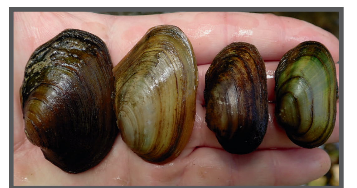
4 espèces de Mulettes sur les 5 identifiées sur le territoire de Grand Poitiers