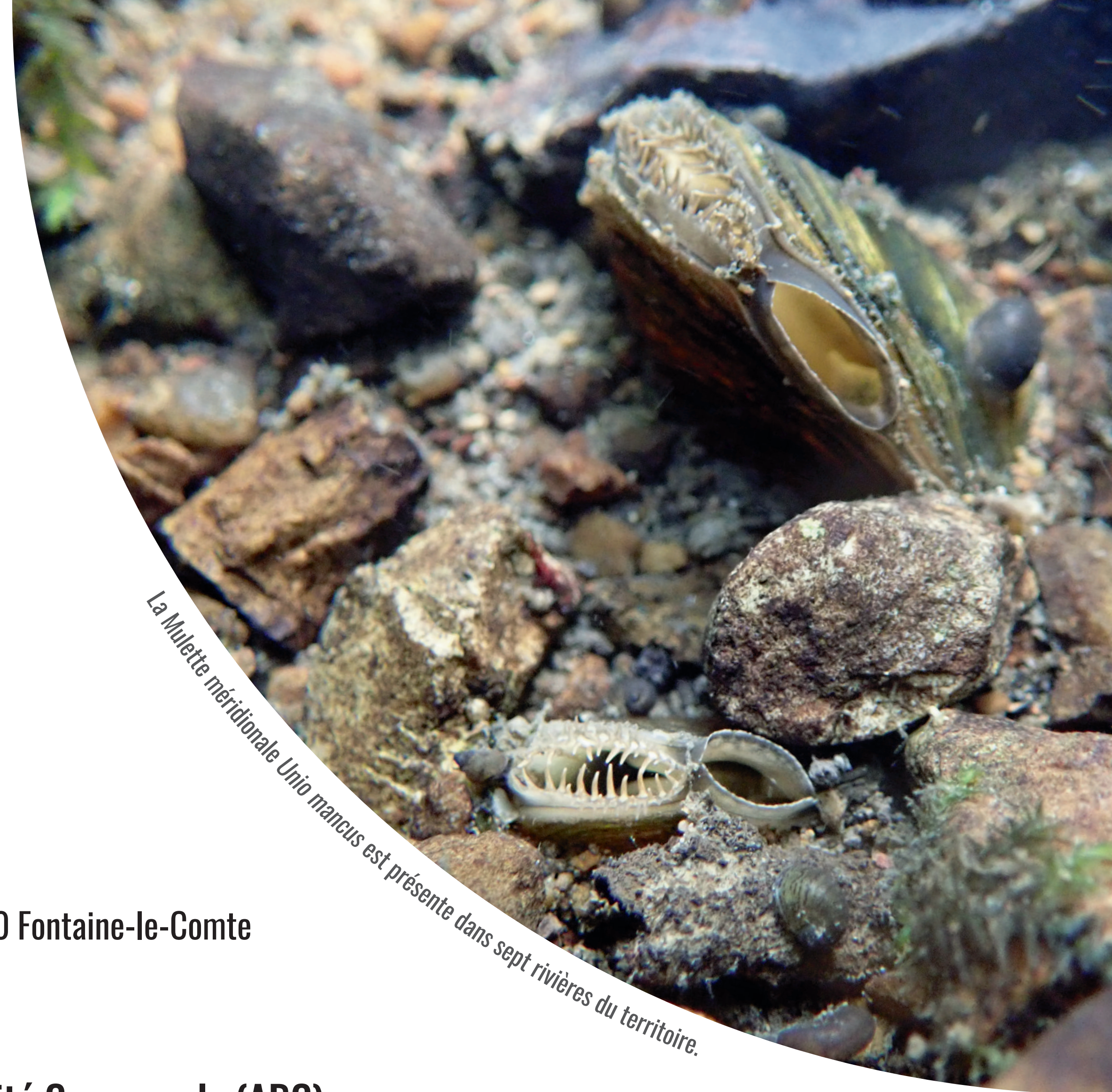
La Mulette méridionale Unio marcus est présente dans sept rivières du territoire.

Vienne Nature, 14 rue Jean Moulin, 86240 Fontaine-le-Comte 05 49 88 99 04 - www.vienne-nature.fr