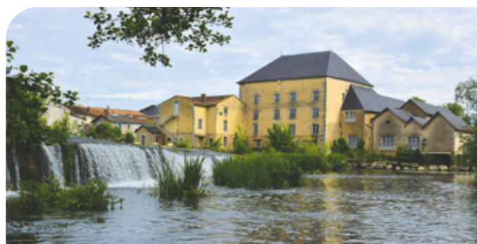
Le moulin d'Anguitard

Pour en savoir plus : www.tourisme-chasseneuil-du-poitou.com/moulin-d-anguitardchasseneuil-du-poitou/activite7