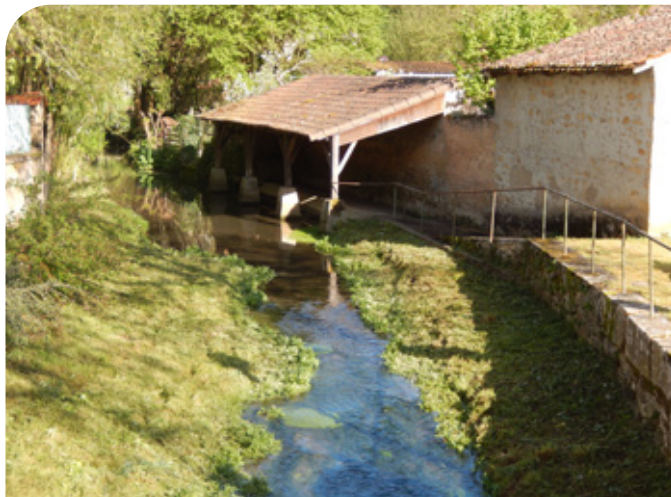
Le lavoir

En 1992, la commune engage des travaux de rénovation des revêtements intérieurs et extérieurs.