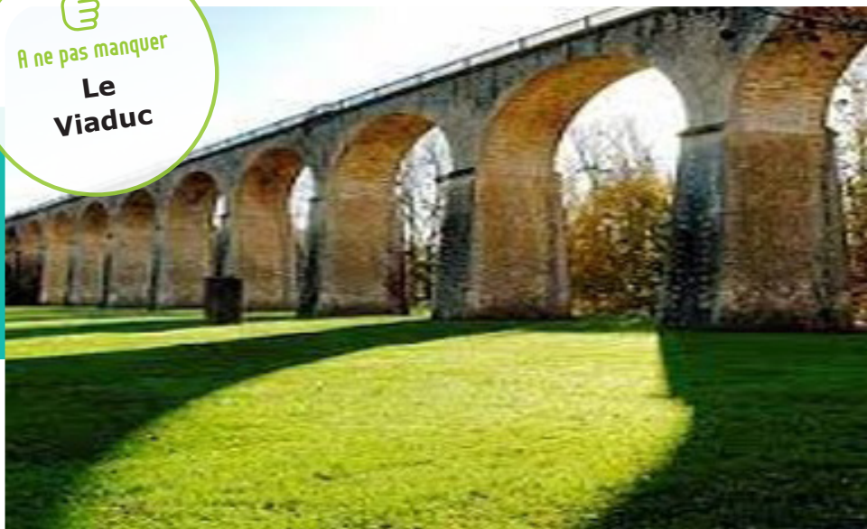
Viaduc de Saint-Benoît

Passage sur le viaduc de Saint-Benoît, construit en 1892 de 328 m. à 20 m. de hauteur, offrant une vue panoramique sur les alentours.