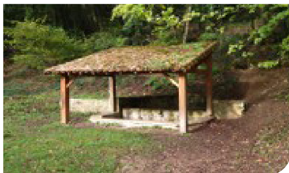
Le lavoir de Vouneuil-sous-Biard

La totalité du circuit est signalé par des bornes en bois numérotées 1A, pouvant se pratiquer dans les deux sens afin de vous offrir des paysages différents selon les saisons, depuis l'une des villes nommées.