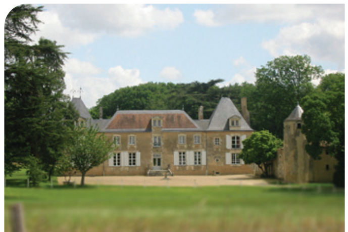
Le château de la Cigogne

● Sainte-Jeanne est une ancienne ferme dépendant de la Cigogne, en référence à Jeanne d'Arc. On peut y voir le blason de celle-ci.