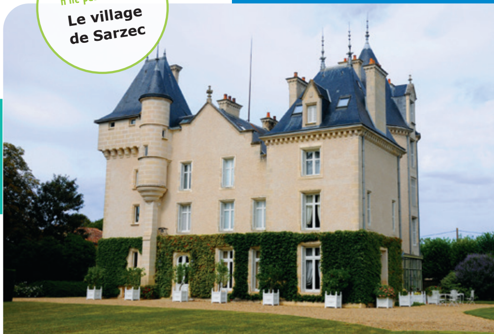
Château de Sarzec

Composée de onze villages de charme chargés d'histoire, la commune de Montamisé a conservé un aspect rural. Sarzec est l'un de ces villages.