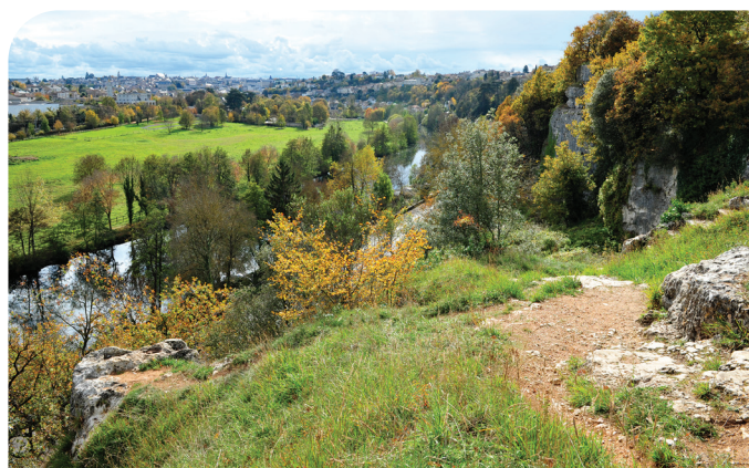
Les rochers du Porteau

La création du cimetière de l'Hôpital-des-Champs remonte aux années 1520-1530. Son existence est liée à l'implantation d'un hôpital créé hors la ville, « dans les champs », pour soigner les malades lors de l'épidémie de peste qui sévit dans la région en 1516.